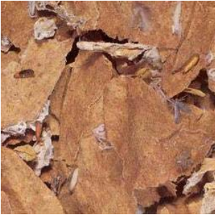
Tütün güvesi zararı