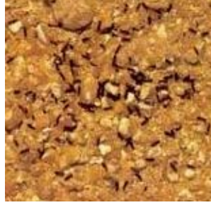
Küçük kırma biti zararı