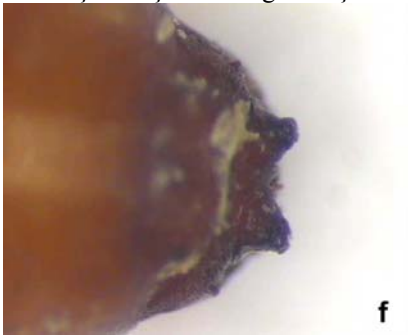
Pupada son segment