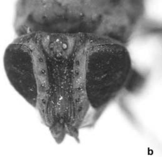
Dişide başın önden görünüşü