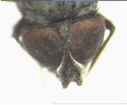
Erkek başın önden görünüşü